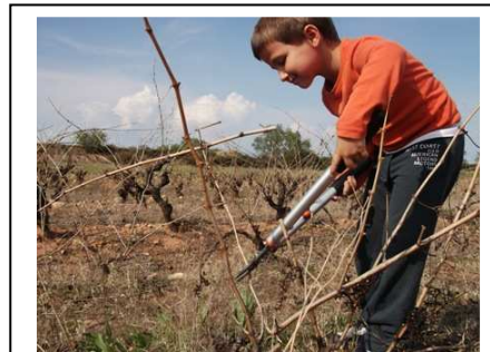
“Podamos la vid de ramas malas